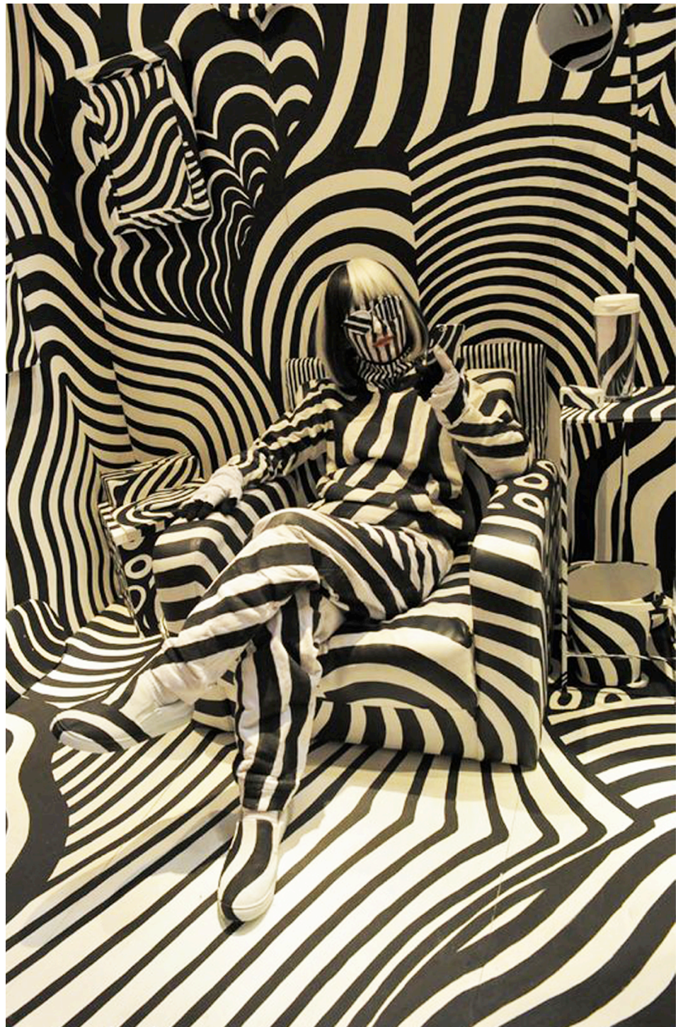
Photo de l'Installation-Happening « Dazzle Room » de Shigeaki MATSUYAMA, 2016

WORKSHOP DE RECHERCHES ARTISTIQUES BA1-BA2 24 – 25 – 26 janvier 2018