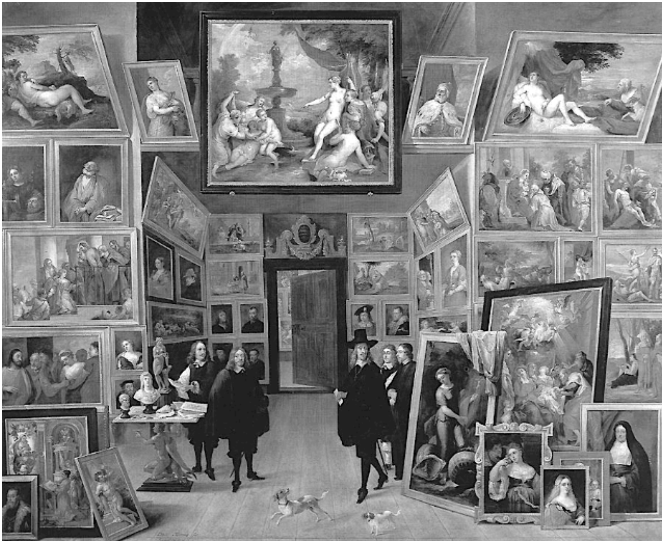
« L'Archiduc Leopold-Guillaume dans sa galerie de peintures » David TENIERS Le Jeune, 1647