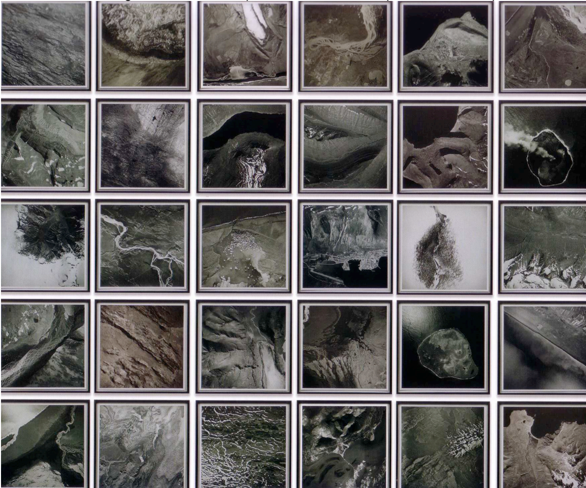
« Cartographic series III » Olafur ELIASSON, 2004